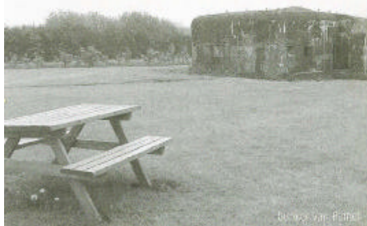
bunkers van Pamel

Waterputten, grenspalen, kapellen, kruisen, roepstenen, grenspalen, schandpalen, ... Het landschap -zeker in het Pajottenland- staat er bol van. Heel vaak beschouwen we dit verkeerdelijk als kleinhistorisch erfgoed. In feite zijn dit landschapsrelicten. In vorige nieuwsbrieven kwamen al het kleinhistorisch erfgoed, het natuurlijk erfgoed, het woon-, werk- en publiek erfgoed, het roerend patriomonium en ook het religieus erfgoed aan bod. In deze laatste nieuwsbrief willen we u een laatste categorie relicten toelichten, met name het militair en het maritiem erfgoed.